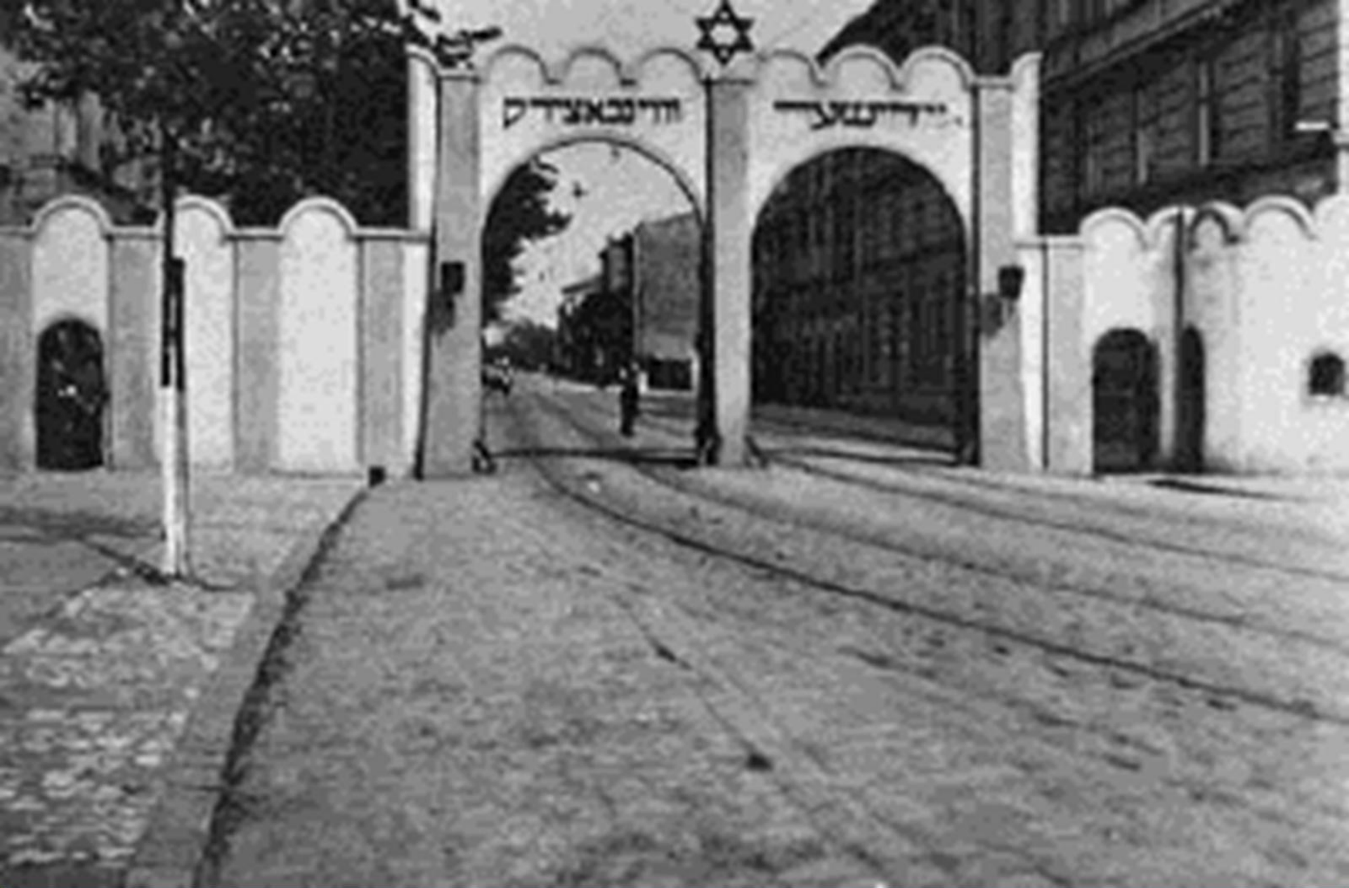
Les portes du Ghetto de Cracovie