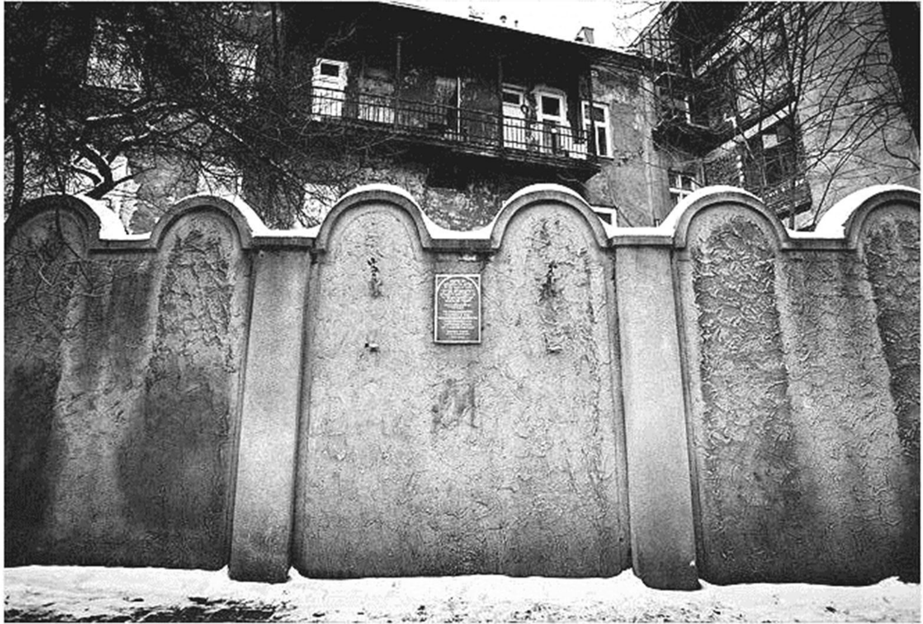
Le Ghetto de Cracovie