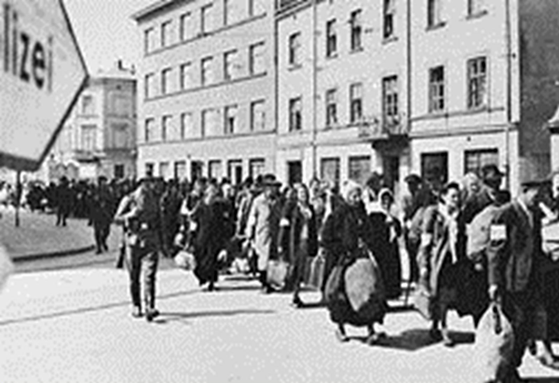
Déportation des Juifs du Ghetto de Cracovie en Mars 1943.