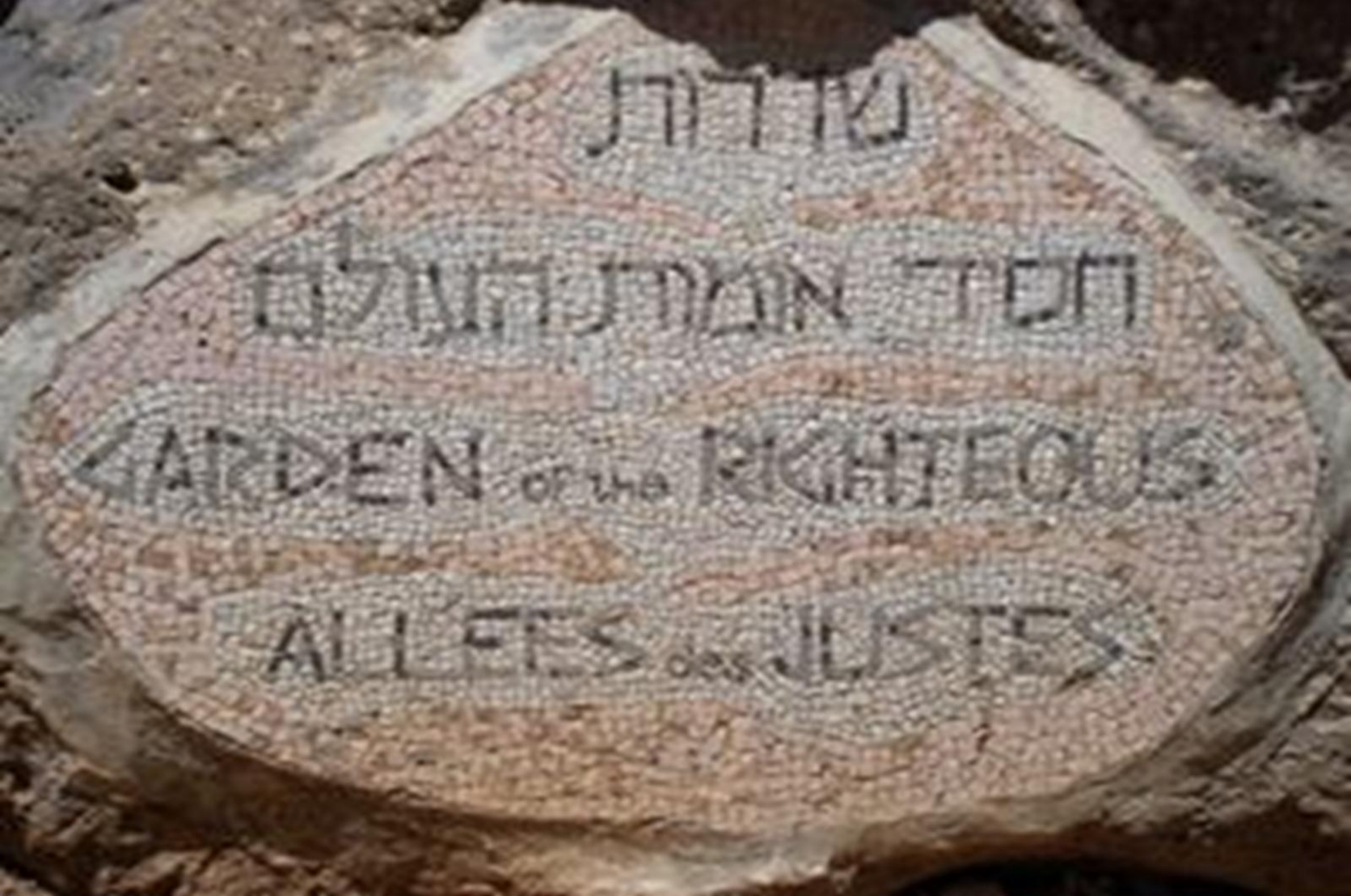
La stèle à l'entrée de Yad Vashem, rappelle des Justes.