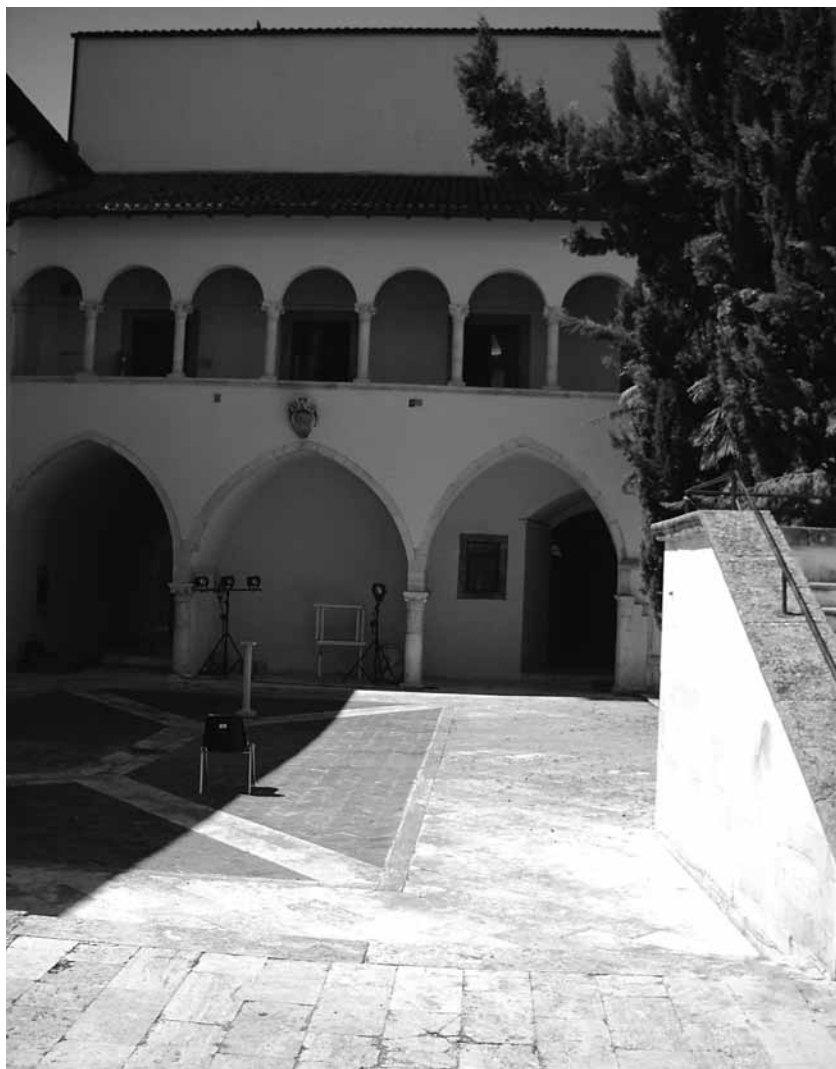
(fig. 5) Il cortile centrale dell'ospedale.

e addebitandone le spese allo speciale (18) .