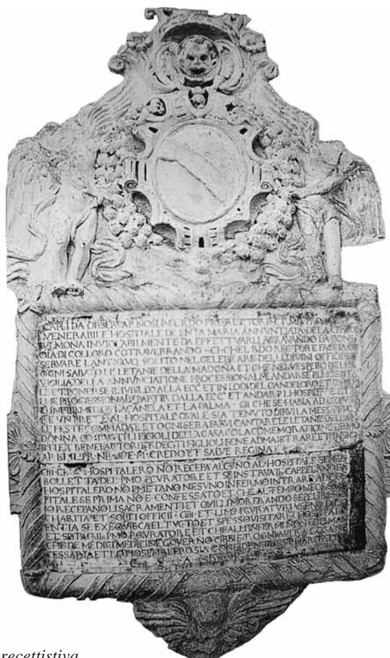
(fig. 6) Iscrizione marmorea precettistica.

negli anni 1794-1804; 197 ducati negli anni 1805-10; 180 ducati negli anni 1811-17; 237,6 ducati negli anni 1818-20; appena 25,67 ducati negli anni 1828-33 e, poi, 25 ducati dal 1834 al 1863 (19) ;