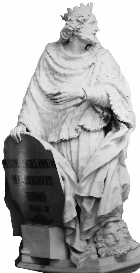
(fig. 10) Re Salomone.

reale di Umberto I e Consorte (che recita: « Templum istud nosocomium gynaeceum notharum puellarum Hubertus I Italiae Rex comite Consorte Sua Margarita piissime visit laetus que visa probavit postridie cal. septemb. MDCCCXCV. Hubertus I. IV cal. augusti MDCCCC ferali ictu occubuit illico sit sicarius anathema maran