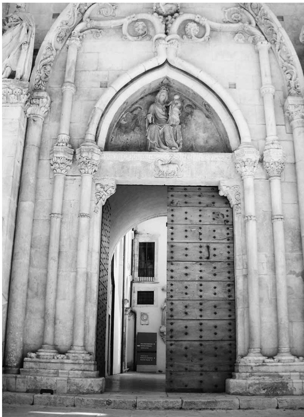
(fig. 3) Portone d'ingresso dell'ospedale.