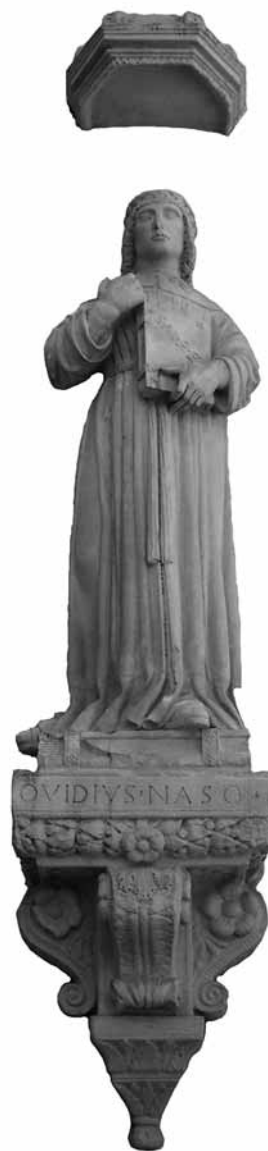
(fig.4) Particolare della statua di Ovidio (nato a Sulmona).

Un impiego presso la SS. Annunziata era assai ambito dai medici sulmonesi. L'organico fisso comprendeva un numero di medici variabile da tre a cinque più uno o due chirurghi e un ristretto numero variabile di infermieri, barbieri e inservienti. Vi erano, inoltre, un "controloro", spesso coincidente con la figura dell'infermiere maggiore, e un cappellano. Il personale, dun-