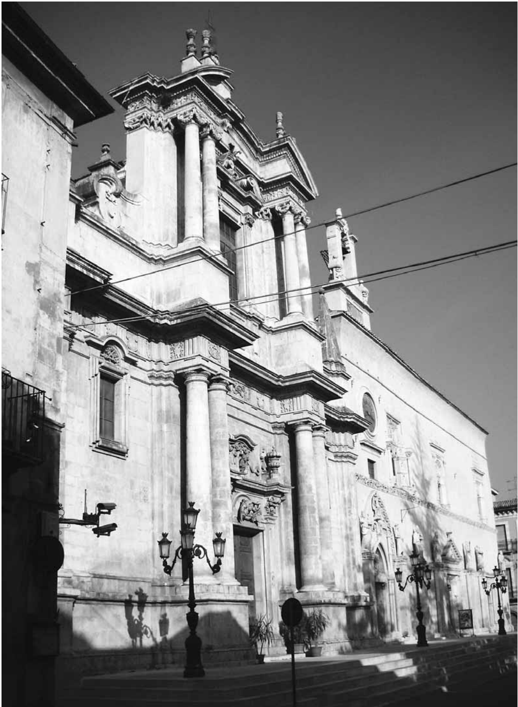
(fig. 1) Chiesa dell'Annunziata.